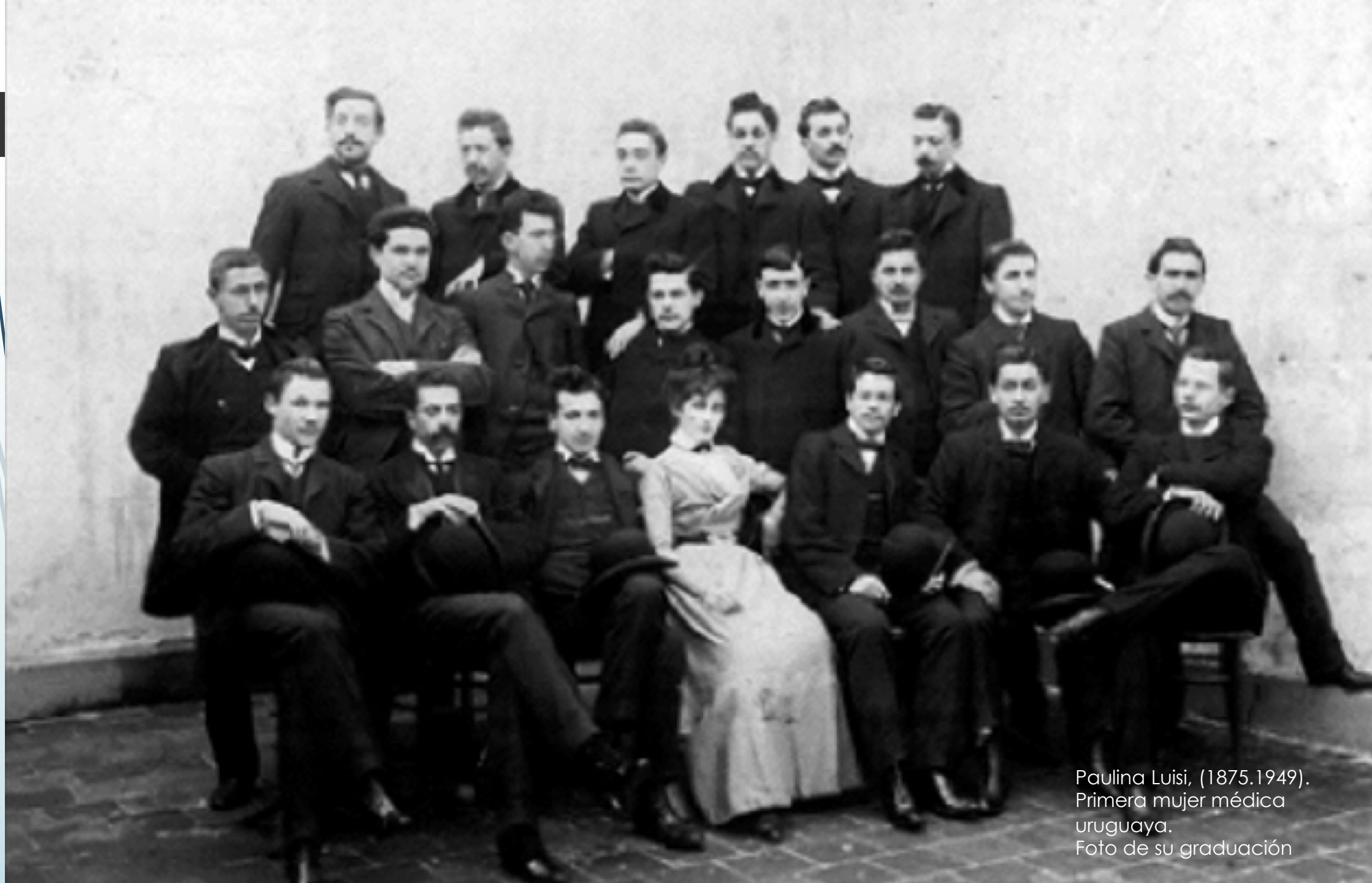
Paulina Luisi, (1875.1949). Primera mujer médica uruguaya. Foto de su graduación