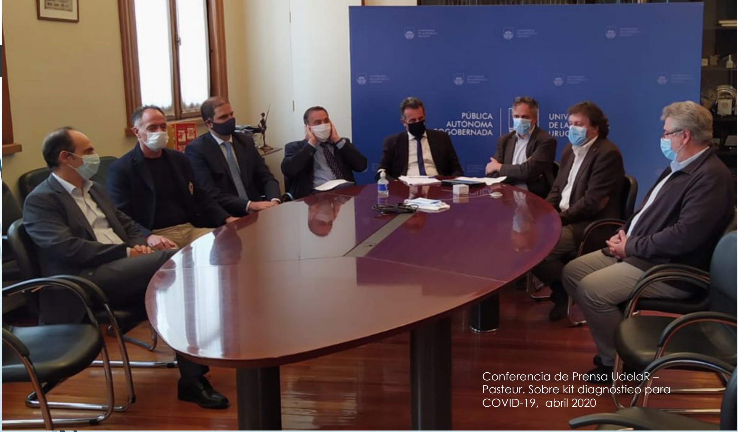
Conferencia de Prensa UdelaR – Pasteur. Sobre kit diagnóstico para COVID-19, abril 2020